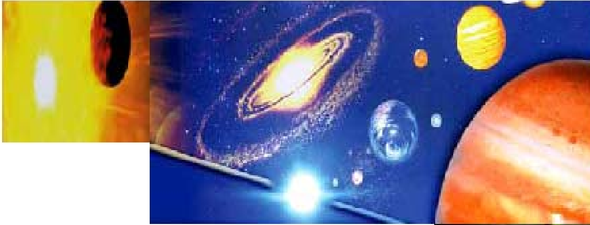
Kainat ve Dünyanın Kıyametini temsil eden resmi.

Cuma, 16 Nisan 2010 16:52 - Son Güncelleme Salı, 05 Mayıs 2020 14:27